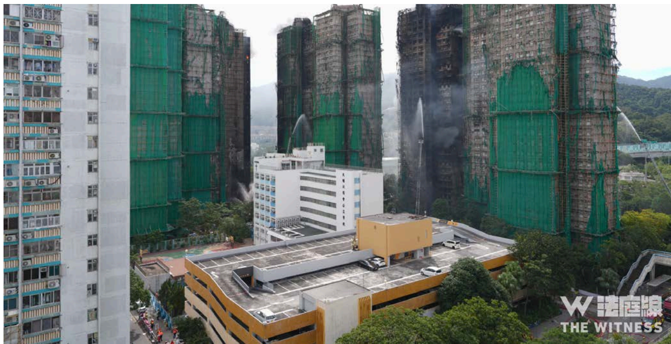
宏福苑屋苑正進行大型維修工程，大廈外牆搭建了棚架與綠色棚網。