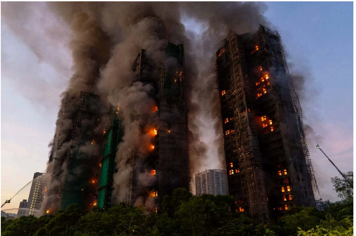
宏福苑宏昌閣周三下午起火，火勢迅速蔓延至屋苑中 7 幢大廈。

處方續指，在上述巡查行動中，發現工程有不安全高處工作情況，已向相關承建商發出 6 張「敦促改善通知書」和作出 3 宗檢控。處方未有提及控罪詳情。